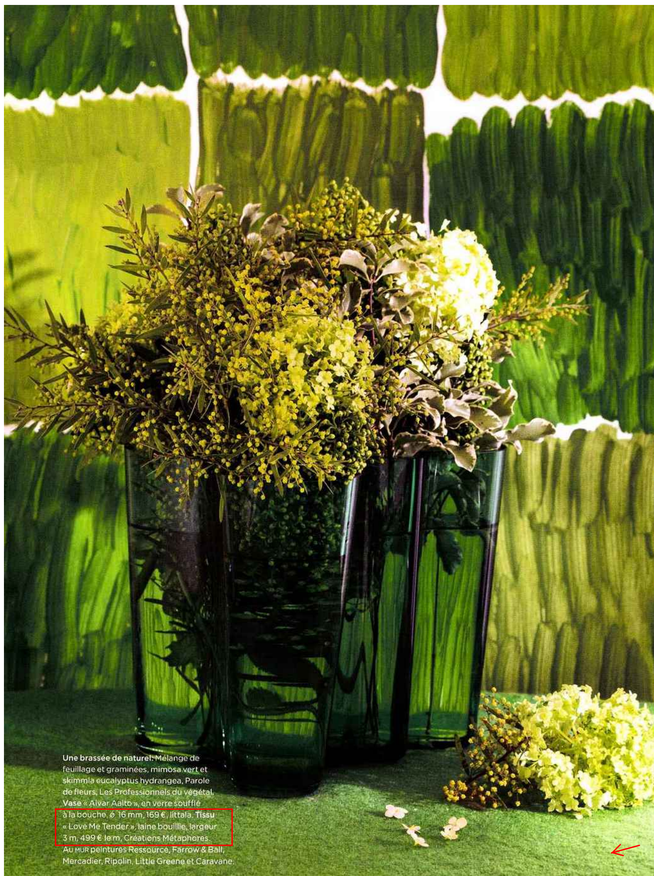
Une brassée de naturel. Mélange de feuillage et graminées, mimosa vert et skimmia eucalyptus hydrangea, Parole de fleurs, Les Professionnels du végétal. Vase « Alvar Aalto », en verre soufflé à la bouche, ø 16 mm, 169 €, Iittala. Tissu « Love Me Tender », laine bouillie, largeur 3 m, 499 € le m, Créations Métaphores. Au mur peintures Ressource, Farrow & Ball, Mercadier, Ripolin, Little Greene et Caravane.