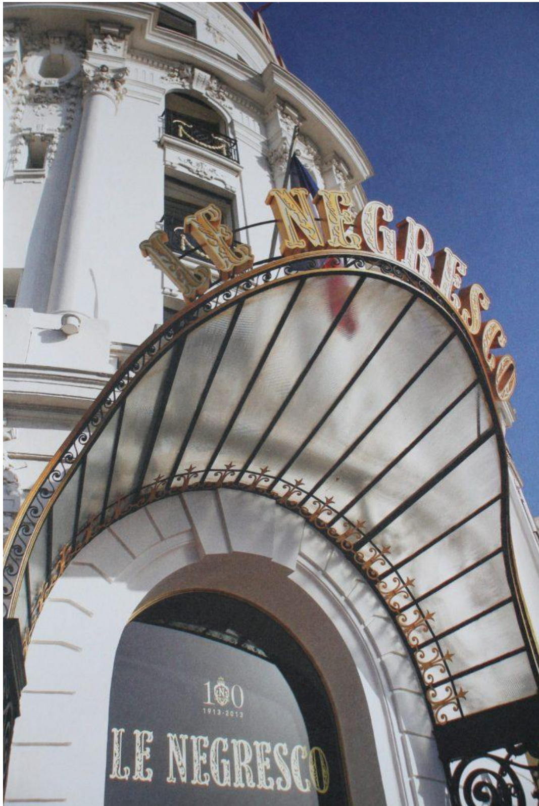
Negresco. tirée du livre