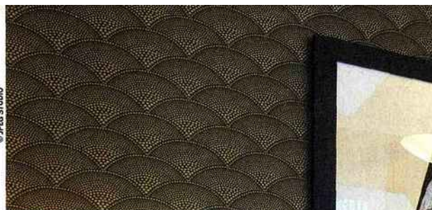
L'une des chambres, avec au mur une tapisserie reproduisant un motif art déco, et un placard d'époque.