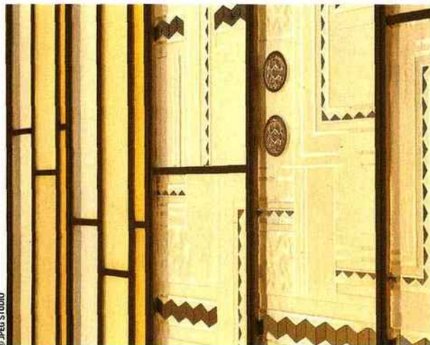
Détail de la verrière, rénovée par le maître verrier Gérald Franzetti . Le jeu graphique est typique des années 1930.